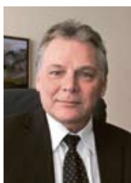
Jacques Melly, conseiller d'Etat

«Après une découverte tardive par mon engagement politique, je m'y rends avec plaisir en pensant aux milliers de sourires qui seront échangés lors de belles rencontres.»